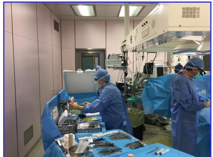
Erweiterung der Schutzzone

Bestehende 1 B- OP-Säle können schnell und kostengünstig aufgerüstet werden. Die Positionierung des Operio Gerätes ist sehr einfach. Die sterilen OP-Abdeckungen mit Barcode-System ermöglichen eine elektrische Höhenverstellung der Geräte vom „sterilen OP-Personal“ intraoperativ – oder auch vom übrigen OP-Personal mittels Display auf der Rückseite des Operio Air Flow Gerätes. Die Geräte sind extrem schmal (32 cm) und können somit universell genutzt werden.