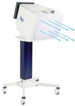
Toul 400 Mobile