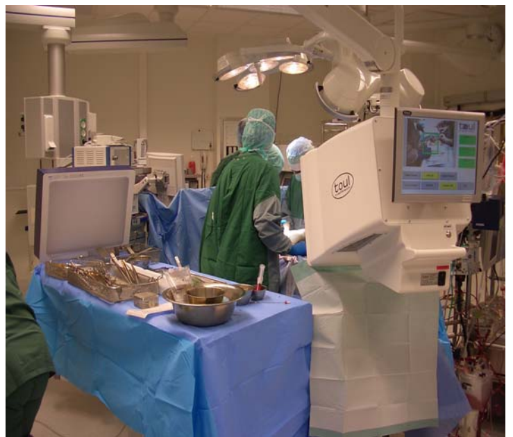
Gli strumenti, il materiale protesico ed i tessuti dei pazienti (ad es. i legamenti) sono protetti dai microrganismi