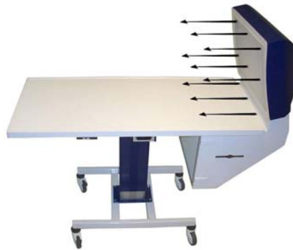
Toul 300 Portaferri