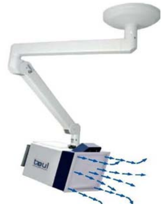
Toul 200 Plafonnier