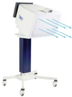
Toul 400 Mobile