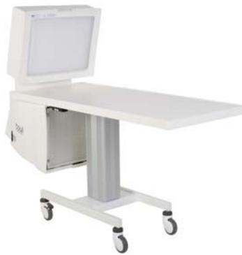
Toul 300 Table d'instruments