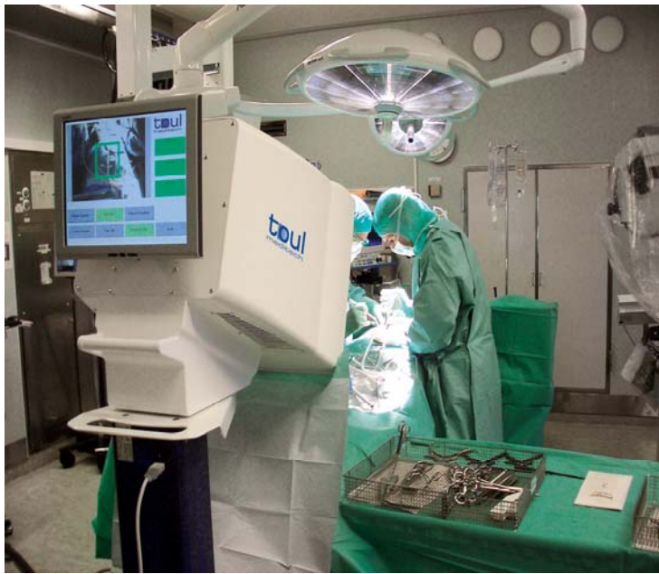
Un moniteur avec écran tactile d'utilisation aisée assure le positionnement optimal du TouL.