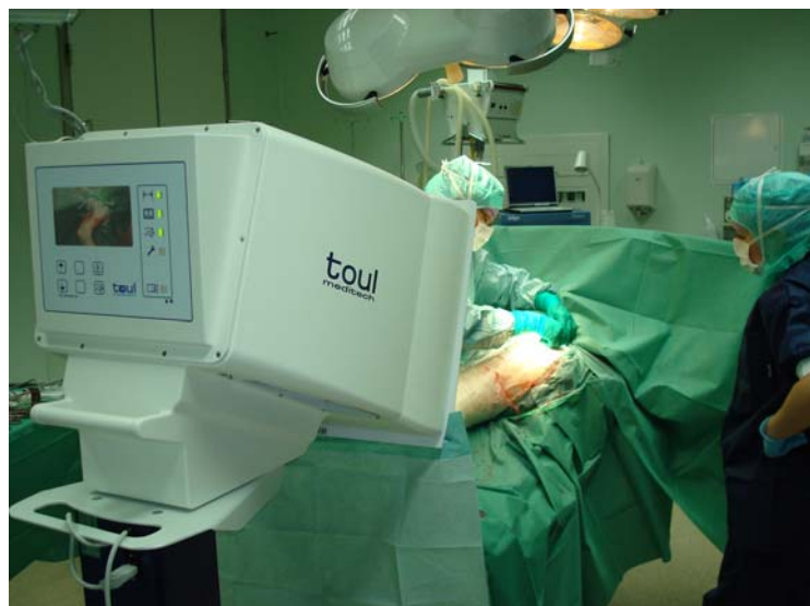
La proximité imminente de Toul réduit jusqu'à 95% la concentration de germes dans le champ opératoire

Le nombre toujours croissant de germes multi résistants (p.ex. MRSA) nécessite une absence accrue de germes dans les salles d'opération. La majorité des infections postopératoires est due aux bactéries qui peuvent pénétrer dans la plaie durant l'opération. Le chirurgien seul dissipe déjà environ 1 million de germes par heure en respirant, en se bougeant ou en transpirant**. La charge intra opératoire en germes de la plaie et des instruments augmente proportionnellement avec la durée de l'opération et du nombre de personnes dans la salle. La charge en germes dans une salle d'opération pourvue de ventilation conventionnelle se situe en règle générale entre 50 et 200 UFC/m 3 . 10 UFC/m 3 suffisent à provoquer une infection sérieuse. (Gosden PE, Mac Gowan AP Bannister GC J. Hosp. Infect 1998).*1. Noble W.C.: Dispersal of skin microorganism Brit. J. Dermatol. 93: 477-490, 1975).