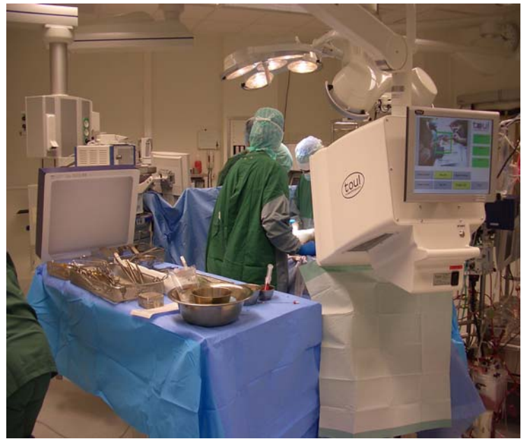
Protection du champ opératoire, des implants et des instruments contre les microorganismes.